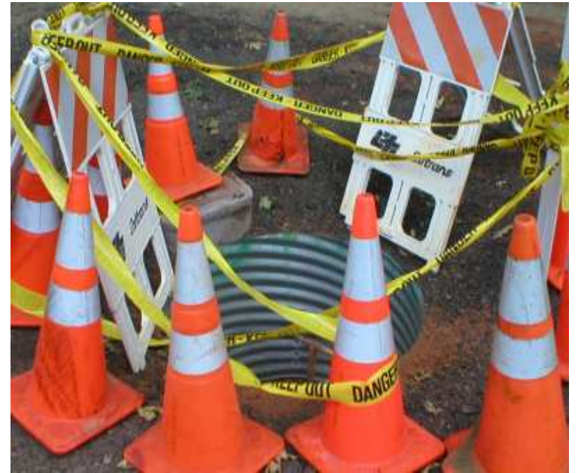
Een vicieuze cirkel, waaruit geen redding mogelijk lijkt...

Concurrentiegeest, verdeeldheid, ieder-voor-zijn-eigen-club... maken ons als een stad omringd door bressen: de vijand wandelt rustig binnen en buiten, ondervindt bijna geen weerstand en rooft onze geliefden zomaar weg.