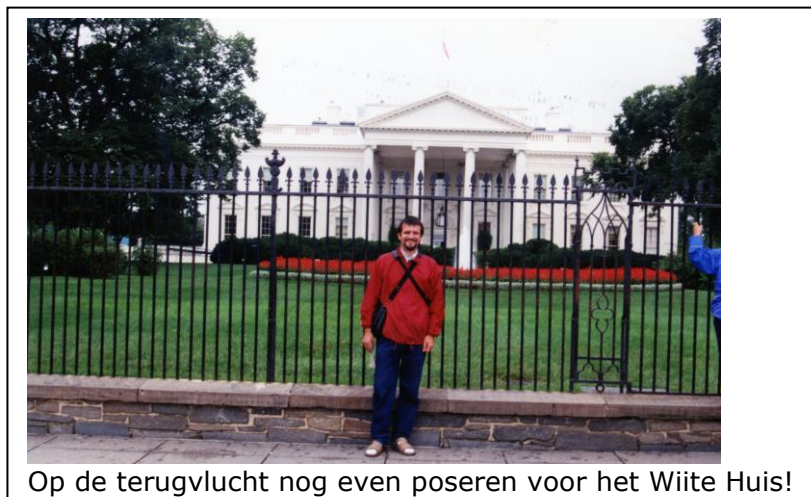
Op de terugvlucht nog even poseren voor het Witte Huis!